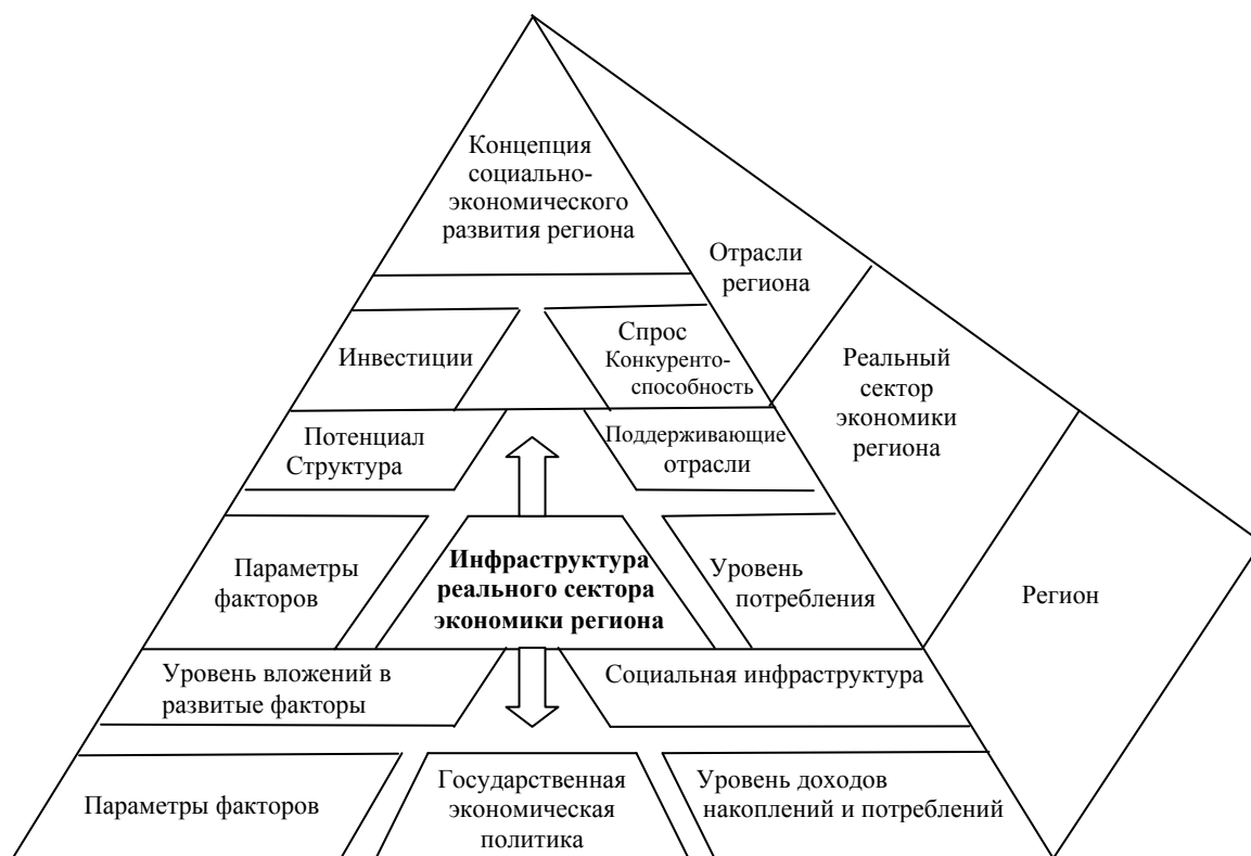
Рис.1. Влияние межотраслевых и внешнеэкономических связей на инфраструктуру реального сектора в экономике региона

Отраслевая классификация инфраструктуры реального сектора экономики региона получила самое большое распространение (табл.1), исходя из того, что каждая отрасль и вид деятельности экономики имеет свою специфическую инфраструктуру, отвечающую требованиям основного производства, а элементы инфраструктуры отдельных подсистем часто пересекаются, являются общими, взаимозаменяются.