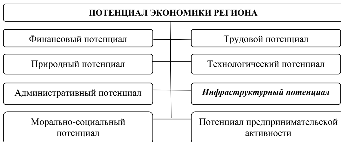
Рис. 2. Структура потенциала региона 1

с его возможностями в какой-либо сфере. Под потенциалом экономики региона (рис.2) понимается совокупность ресурсов, средств и источников различного свойства, которыми обладает регион и которые могут быть вовлечены в воспроизводственный процесс для достижения целей развития территории и, в первую очередь, для улучшения условий жизни населения. Оценка потенциала экономики региона - это, прежде всего, оценка качества жизни населения на территории региона, привлекательности территории для жителей, предпринимателей, инвесторов, туристов.